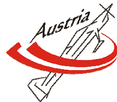
PRELIMINARY SCHEDULE P-11 (from January 2010)